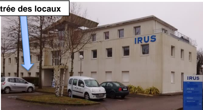
Entrée des locaux

Des emplacements de stationnement sont disponibles devant les bâtiments.